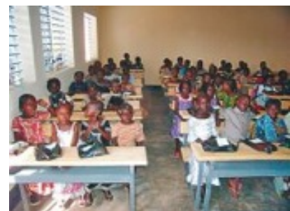
Erster Schultag: Mitte September wurde die von „Sababu“ errichtete neue Grundschule in der Stadt Bobo-Dioulasso nach rund acht Jahren Bauzeit feierlich eröffnet.